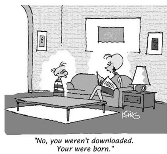
Figura 1. Uma figura com título curto

Legendas de figuras e tabelas devem ser centralizadas se menos de uma linha (Figura 1), justificado e recuado por 0,8 cm em ambas as margens, conforme mostrado na Figura 2. A fonte da legenda deve ser Helvetica, 10 pontos, negrito, com 6 pontos de espaço antes e depois de cada rubrica.