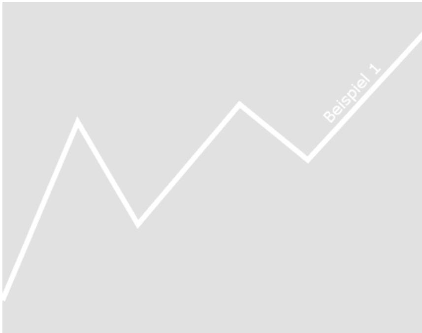
Abbildung 1.1: Beispiel 1 zum Einfügen einer Grafik

hac habitasse platea dictumst. Curabitur at lacus ac velit ornare lobortis. Curabitur a felis in nunc fringilla tristique.