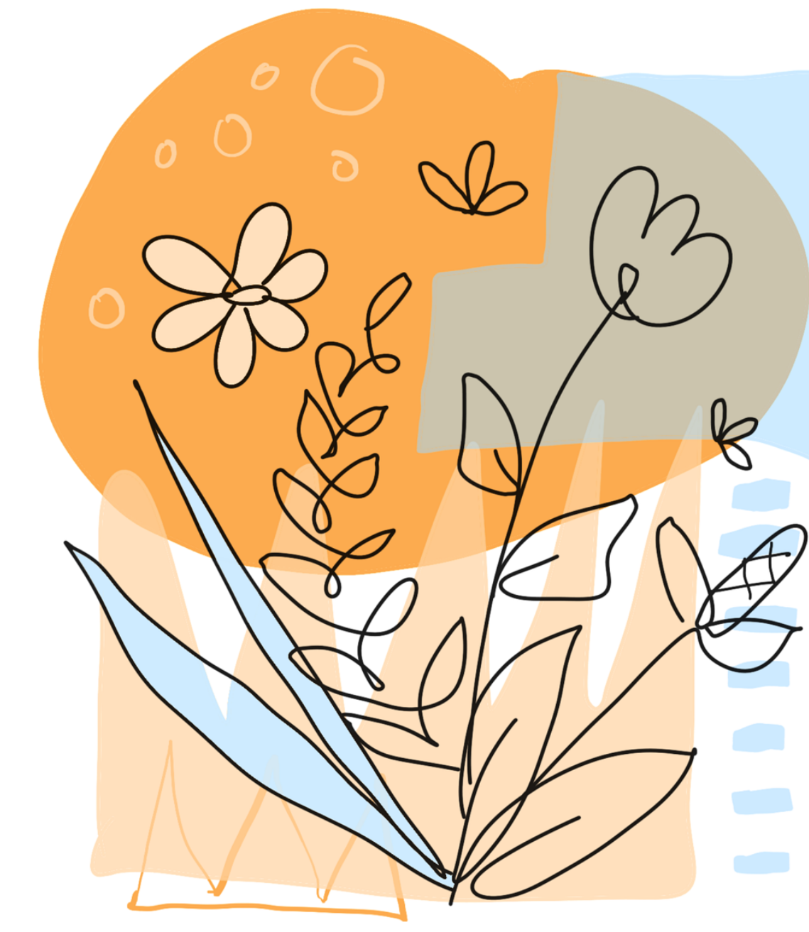
Figure 2.

Pellentesque eget convallis lorem, vel vestibulum nisl. Vivamus suscipit augue at ipsum commodo semper. Duis hendrerit, metus non scelerisque ultricies, libero dolor malesuada diam, fermentum scelerisque augue justo a erat.