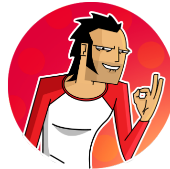
Figura 2. Si el caption va después