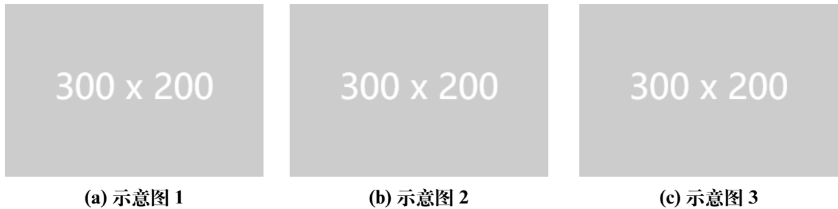
图 2 一行三张子图并排示意